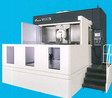
5軸制御立形マシニングセンタ V100S