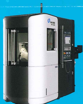
5軸制御横形マシニングセンタ N2-5XA