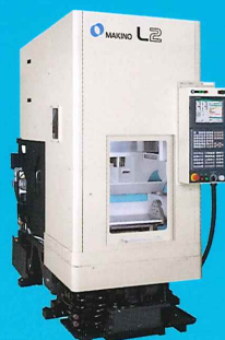
立形マシニングセンタ L2 (旋削仕様)