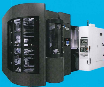
5軸制御立形マシニングセンタ DA300 自動化パッケージ