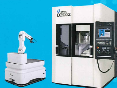
5軸制御立形マシニングセンタ D200Z 製造支援モバイルロボット iAssist