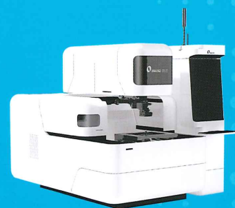
ワイヤ放電加工機 UPX600