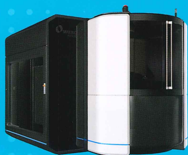
5軸制御横形マシニングセンタ a900Z