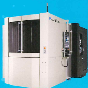
横形マシニングセンタ a61nx