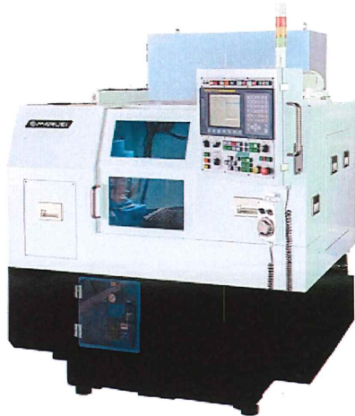
CNC 内面複合研削盤 NIG-300