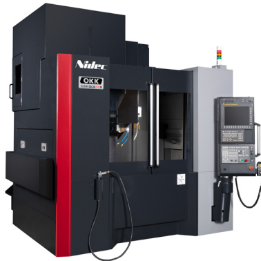
立形マシニングセンタ VM53RII