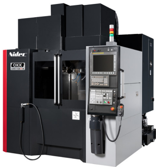
立形マシニングセンタ VM43RII