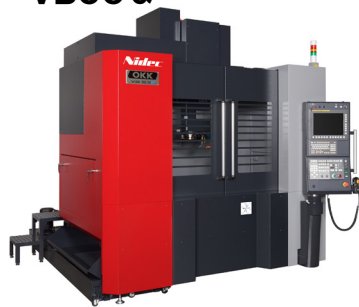
立形マシニングセンタ VB53α