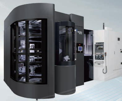
5軸制御立形マシニングセンタ DA300 -自動化パッケージ-