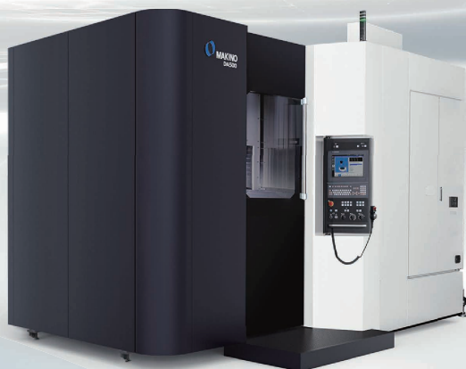
新製品 5軸制御立形マシニングセンタ DA500