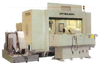
5軸制御 横形マシニングセンタ HU80A-5X