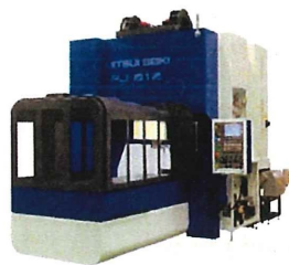
プレジジョン プロファイルセンタ PJ812