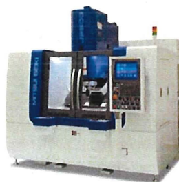
高精度ジグ研削盤 J350G