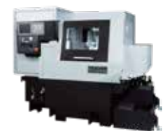
SS20MH-III-5AX 同時5軸制御機能と最高回転速度25,000min -1 のツールスピンドルを搭載した主軸移動型複合加工機