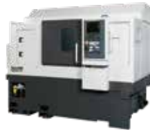
MO8SY-II Y軸付タレットと背面主軸を搭載したCNC旋盤