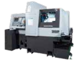
BW329ZJ 3つの独立した刃物台により、多彩なオーバーラップ加工が可能な自動旋盤