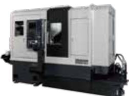
SS38MH-5AX 同時5軸制御機能を搭載し、φ38までの棒材に対応する主軸移動型複合加工機