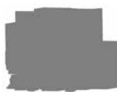
G22 NEW 待望のG18-IIとG300の中間サイズワークに対応したCNC精密円筒研削盤