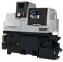
BO205-VR NEW 豊富な実績を持つベストセラーシリーズにさらなる改良を加え、加工能力を向上