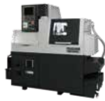
BO126C BOシリーズの奥行きを抑えたコンパクトタイプ