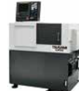
C200 NEW 高精度仕上げ加工を実現するコンパクト仕様のクシ型旋盤