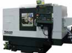
G300W-500AN NEW 旋回式といし台のアンギュラ+内研仕様