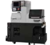
PO36W リニアモータを搭載したP0シリーズの独立対向刃物台仕様機