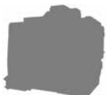
VA4-II NEW 30本マガジンを標準搭載し多品種生産に対応する立形マシニングセンタ