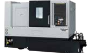
M10D 10インチチャック搭載のCNC旋盤 回転工具の搭載が可能