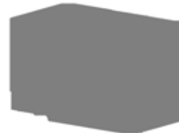
M10JL10 NEW 10インチチャック搭載のCNC旋盤 1,000mmの長尺ワークを加工可能としたロングストロークタイプ