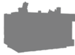
FMA3H-V NEW 独創的な基本構造にリニアスケールを搭載した、高性能マシニングセンタ