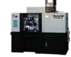
R17NC-II 分割ダイスの使用など、複雑転造が可能なNC旋盤