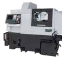
SC206A-II モジュラーツーリングと豊富なオプションの搭載が可能な自動旋盤のパーツフィード仕様