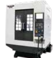
VA3S NEW ダイレクト式ATCを搭載し工具交換時間の短縮を可能とした立形マシニングセンタ