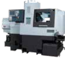
SS327-II-5AX B軸刃物台と同時5軸制御機能により複雑形状部品の加工が可能