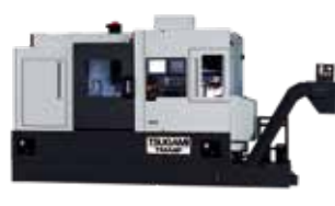
TMA8F 同時5軸制御機能とリニアスケールを搭載した高精度複合加工機