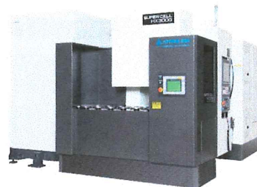
同時 5 軸制御横形 FMC SUPERCELL 300G with 20APC & 174ATC