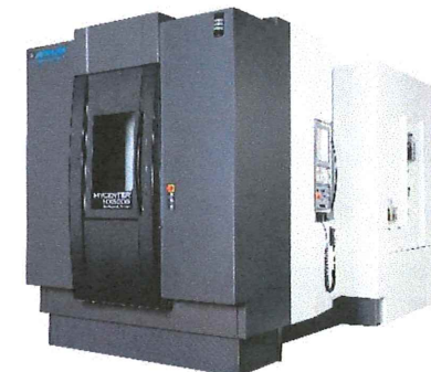
高剛性高精度横形マシニング センタ MYCENTER-HX500iG/630 with 62ATC & 630mm テーブル

IoT に対応する第4世代型独自開発の CNC 装置「Arumatik-Mi」を搭載