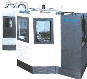
高速高精度横形マシニング センタ MYCENTER-HX300iG/400 with 8APC & 100ATC