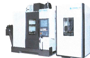
5 軸制御立形マシニング センタ MYTRUNNION-2G with 10APC & 90ATC